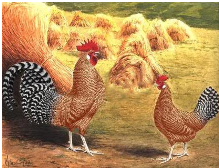
Roodkoekoek, het ideaalbeeld waar de rode staart nog ontbreekt. Tekening door van Gink, bewerkt door A.J. vd Berg